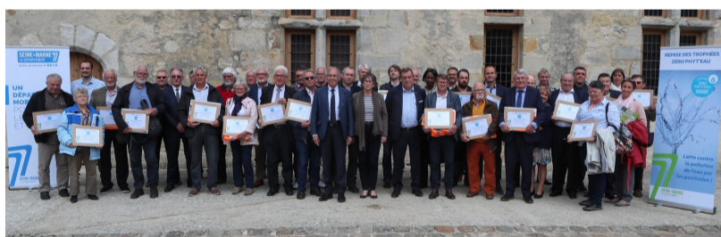
Remise du Trophée « Zéro Phyt'Eau », le 12 Juin à Blandy-les-Tours